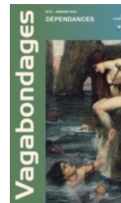
Magazine - CH N°51