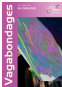
VAGABONDAGES Magazine - CH Valvert N°53