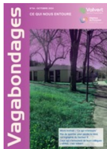
Magazine - CH Valvert N°54